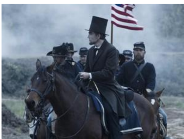
Cena do filme 'Lincoln'

De domésticas à Revolução Francesa, eles ajudam a reforçar conteúdos.